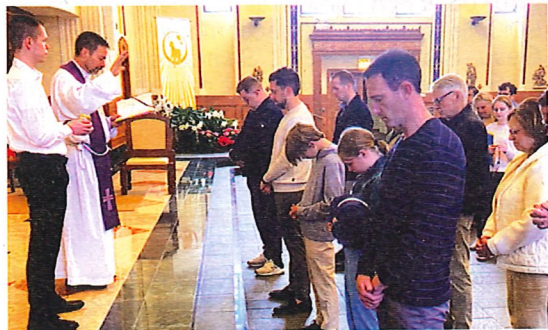
Un momento del rito dell'ammissione al Catecumenato. Tutta la comunità cristiana è invitata a circondare i catecumeni con il suo affetto e assisterli con il suo aiuto.